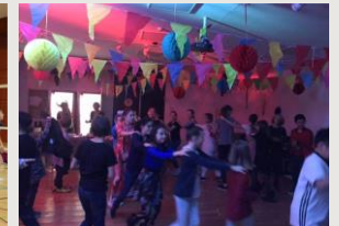
Unterstufen- und Faschingsdisco