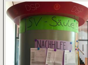
Unsere eigene Litfaßsäule für Informationen und Aushänge

Unsere Priorität ist es, die vierten Klassen in die SV-Treffen einzugliedern, damit auch die Grundschule einen Einblick bekommt. Außerdem stehen Sportturniere, und weitere Schuldiscos und Filmabende an. Außerdem werden wir dieses Jahr die neue Schülersatzung mit der überarbeiteten Wahlordnung präsentieren