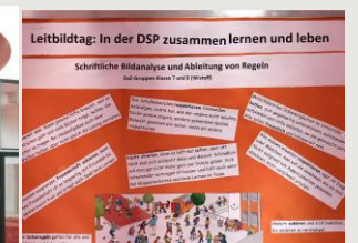
Plakat zum Leitbild der Schule